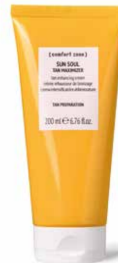
2. SUN SOUL TAN MAXIMIZER