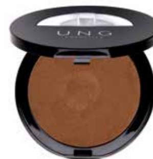
7. UNG BRONZING POWDER