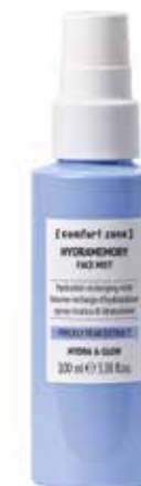
6. HYDRAMEMORY FACE MIST