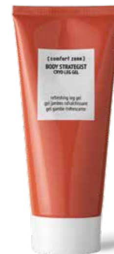
5. BODY STRATEGIST CRYO LEG GEL