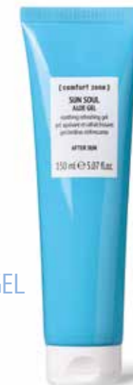
3. SUN SOUL ECO ALOË GEL