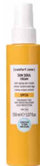
1. SUN SOUL CREAM SPF30

De bronzing powder is een populair product om je het gehele jaar door een gezond en gebruind kleurtje te geven. Creëer een frisse, zomerse en gezonde look met de Bronzing powder van UNG €32,50