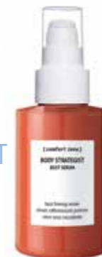
4. BODY STRATEGIST BUST SERUM